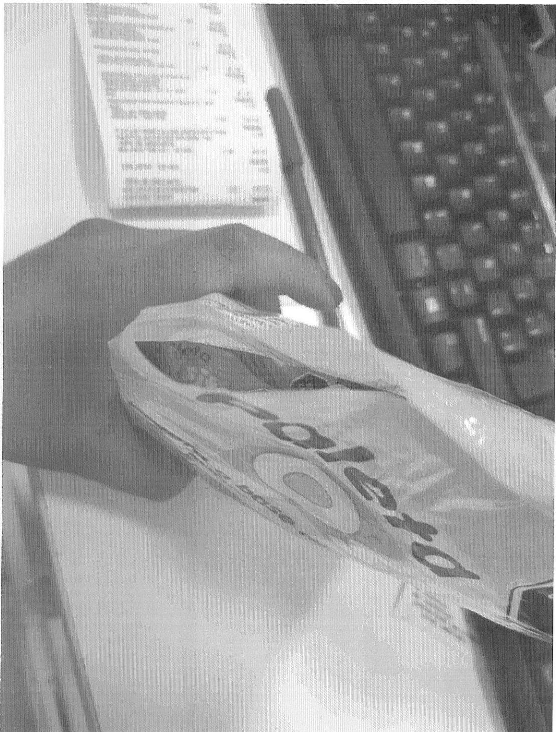
PRODUCTO QUE BIENE ABIERTO (CORTADO)